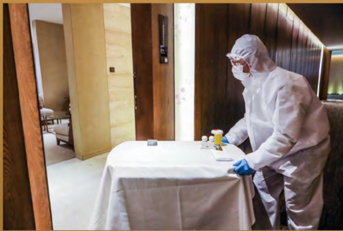
疫情期间上海地产集团各项防疫、抗疫举措