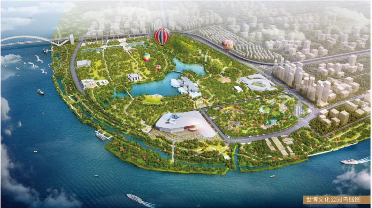
世博文化公园鸟瞰图