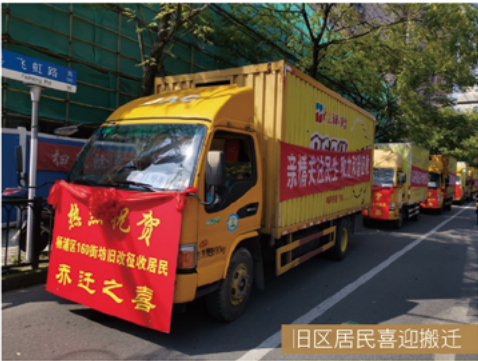
旧区居民喜迎搬迁

围绕《关于加快推进我市旧区改造工作的若干意见》，上海地产集团积极推动15个配套政策制订，基本打通政策路径，试点“诉讼不停止执行”措施，加快项目征收收尾。2020年12月31日，虹口区“17+69”街坊组合地块成功挂牌出让，打通旧改地块捆绑资源地块出让路径，实现旧改制度重大创新，同时率先试点“场所联动”新模式，这一创新成果被纳入上海市出台的《上海市城市更新中心旧区改造项目招商管理暂行办法》。完成2020年新一批项目银团签约和LPR贷款利率转换，进一步夯实旧改资金保障，降低融资成本。截至2020年底，上海地产集团承担的旧改任务占全市近60%，成为本市旧区改造的主力军。首批启动的4个旧改项目中，虹口17街坊、静安洪南山宅项目完成征收收尾。2020年的9个旧改项目按计划全面启动，其中7个项目完成二轮征询，高比例签约生效；2个项目完成第一轮意愿征询。