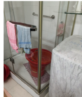
适老化改造前后对比

上海地产集团与上海市民政局合作，共同创建“上海市居家环境适老化改造服务平台”，面向上海全市老年家庭提供一揽子服务。这是全国第一个采用市场化方式运作的适老化改造专项平台，采取“政府监管+功能性国企运营管理+市场化主体参与+市场化机制运作”的模式。在平台运营管理方面，重点打造“五个一”，一套科学合理的适老化改造标准、一套全面规范的适老化改造流程、一个开放便捷的适老化改造信息系统、一套可组合选择的适老化改造菜单、一套针对不同老年人的补贴方案。通过建立标准、规范流程，牢牢把握评估、方案和结算环节，通过遴选机制筛选合格的优质产品商和服务商进入平台，并对其实施的适老化改造过程进行全流程监督、管理。2020年，在本市5区6个街道开始适老化改造首批试点，为上百户老年家庭实施了适老化改造，并获得一致好评，受到各级领导和媒体的高度关注。