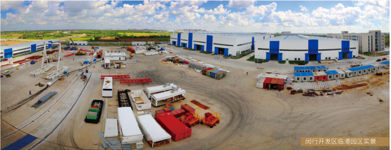
闵行开发区临港园区实景