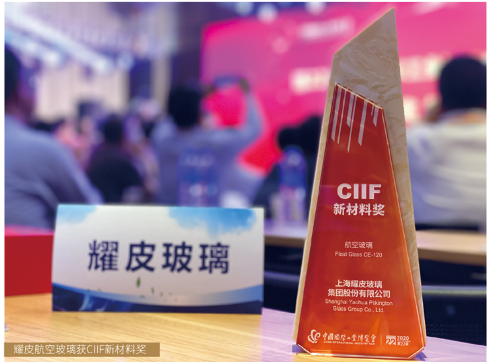
耀皮航空玻璃获CIIF新材料奖