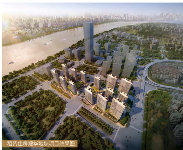
租赁住房耀华地块项目效果图

上海地产集团积极响应政府“房住不炒”、“租购并举”号召，为妥善解决各类人才安居问题全力推进保障性住房和租赁住房建设、运营管理，为优化上海人才发展环境提供居住解决方案。保障性住房方面，截至2020年底，现有保障住房项目17个，总用地面积约72.67万平方米，总建筑面积约171.66万平方米，在建（已开工）项目7个，已投（已拿地未开工）项目10个；另有运营管理的市筹公共租赁住房项目6处，供应房源1.3万多套，住宅面积约70万平方米，累计服务重点单位机构约360家，服务各类人才等约3万人。租赁住房方面，现有租赁住房项目16个，项目总用地面积约42万平方米，总建筑面积约156万平方米，可提供租赁住房1.7万余套，其中11个项目将于2021-2022年竣工。