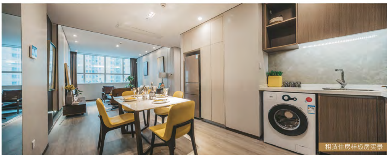
租赁住房样板房实景