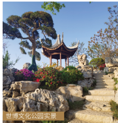
世博文化公园实景

上海地产集团承担建设的世博文化公园为上海市重大工程项目，该项目位于上海浦东滨江核心地区，总用地面积约2平方公里，绿地规模占总建设用地的80%以上，建成后将成为代表国际文化大都市形象、供市民休憩共享的世界一流城市中心公园。世博文化公园于2020年9月启动建设，2020年9月29日，园内“上海温室”项目及其连通道施工许可获取，标志着世博文化公园12个标段全部完成前期报建工作，实现全面开工。2020年底，公园北区景观基本成形，中心湖轮廓呈现；申园（江南特色园）完成建筑基础工程；公园南区双子山及世界花艺园建设全面铺开；世博大道下穿改造工程主体结构基本完成。另外，园内“世界花艺园”项目作为试点，取得了市规划资源局核发的上海首个“一文两证”，同步获批《建设用地规划许可证》和《建设工程规划许可证》，成为上海推进重大项目建设的典型案例。