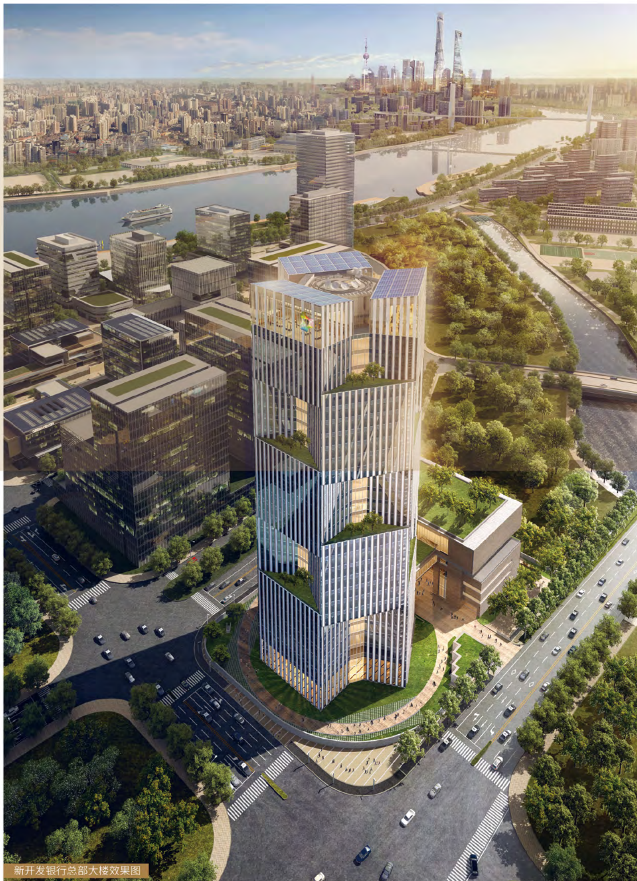
新开发银行总部大楼效果图

09 CORPORATE SOCIAL RESPONSIBILITY REPORT